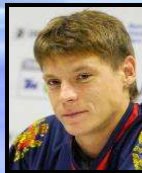
Александр Семин хоккей