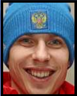
Евгений Устюгов биатлон