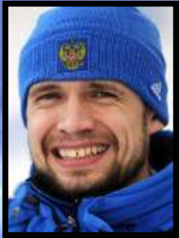
Александр Третьяков скелетон