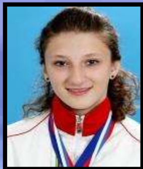
Марика Пертахия фристайл